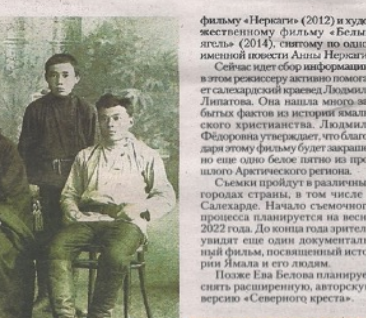
Фильм Евы Беловой рассказывает и о возрождении православия на Ямале.