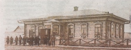
Так выглядело здание Обдорского музея и библиотеки в 1914 году.

Ева Белова уточнила, что сюжетная линия фильма коснется не только биографии Шемановского: